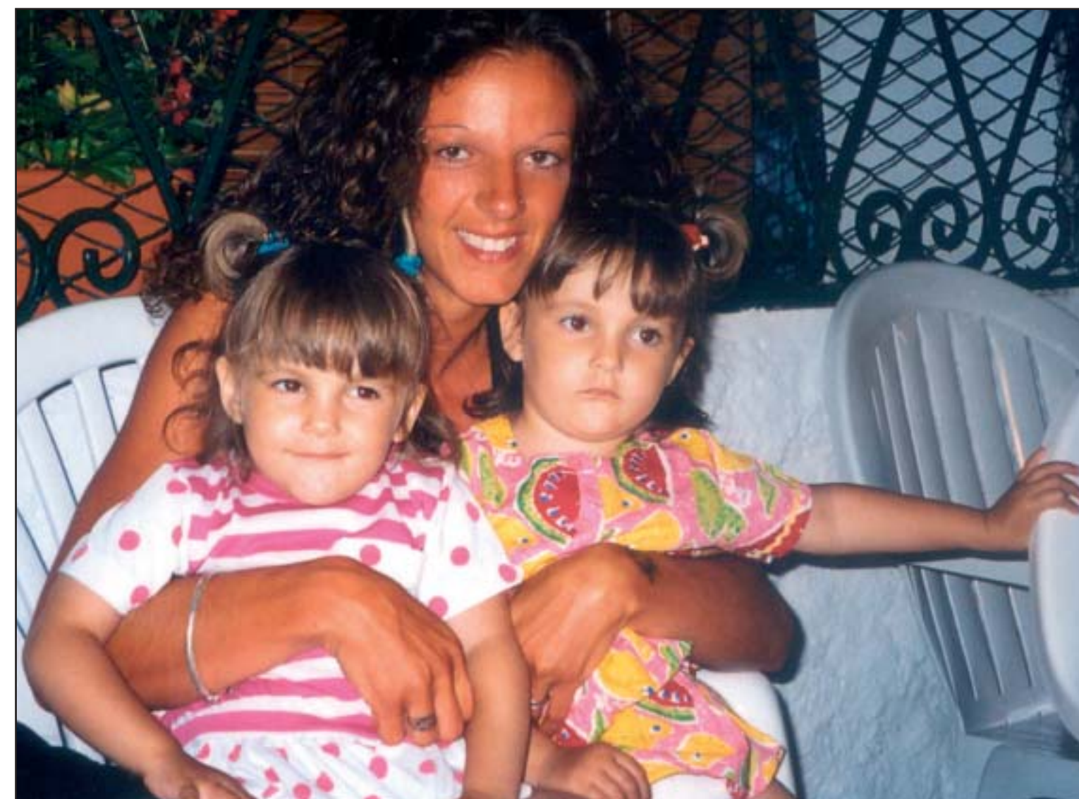
Coccole e relax, questa vacanza è davvero bellissima!

Sodalitas Social Award Degni di nota Filo diretto tra i finalisti